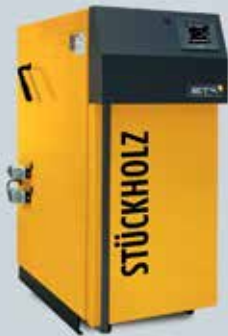
ETA SH Holzvergaserkessel 20 bis 60 kW (20, 30, 40, 50 und 60 kW)