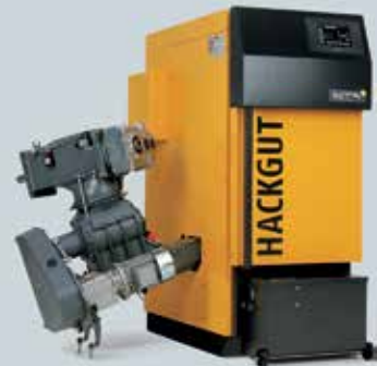
ETA HACK Hackgutkessel 20 bis 200 kW (20, 25, 35, 50, 70, 90, 130 und 200 kW)