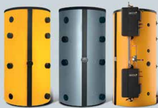
ETA Schichtpuffer SP und SPS (600, 825, 1.000, 1.100, 1.650 und 2.200 Liter) mit Frischwasser- und Schichtlademodul