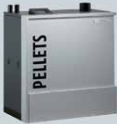
ETA PU PelletsUnit 7 bis 15 kW (7, 11 und 15 kW)