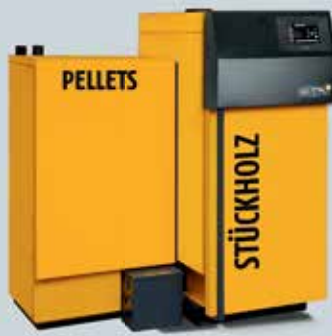
ETA SH-P Holzvergaserkessel 20 und 30 kW mit ETA TWIN Pelletsbrenner 20 und 26 kW