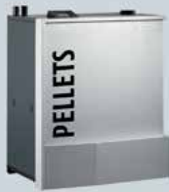
ETA PC PelletsCompact 20 bis 32 kW (20, 25 und 32 kW)