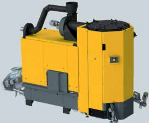
ETA HACK Hackgutkessel mit Vorschubrost 350 kW