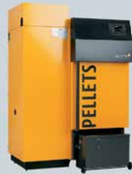
ETA PE-K Pelletskessel 35 bis 90 kW (35, 50, 70 und 90 kW)